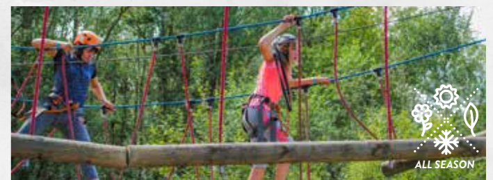
Activiteit met toezicht van een Outsider-monitor