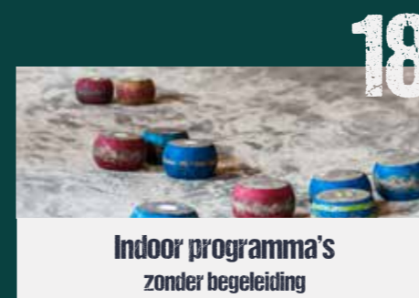
Indoor programma's zonder begeleiding