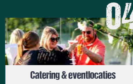
Catering & eventlocaties

De Donkvijver is bijna volledig verkeersvrij te bereiken van aan het station van Oudenaarde. Reken op een 30 à 40 minuten wandelen, afhankelijk van de grootte van de groep.