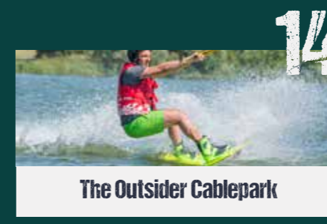
The Outsider Cablepark