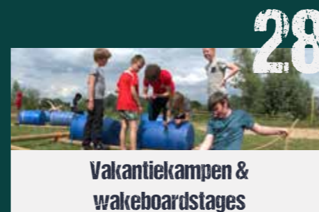
Vakantiekampen & wakeboardstages