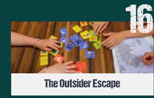
The Outsider Escape