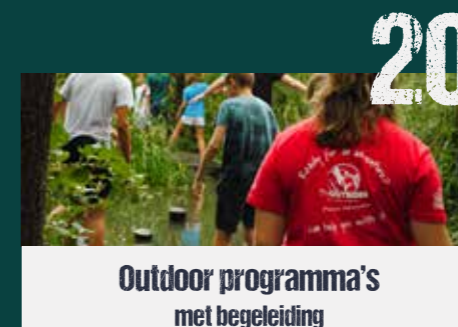
Outdoor programma's met begeleiding